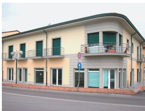
Realizzazioni effettuate da Mugnaini Serramenti.

Commercializzazione: serramenti e avvolgibili di legno, porte per interni Ipea, Selema, Domina, Trep-P&Tre-Più, porte blindate Gardesa, finestre da tetto, tende, zanzariere, motorizzazioni Somfy (l'azienda è Business Partner Somfy) e componenti vari