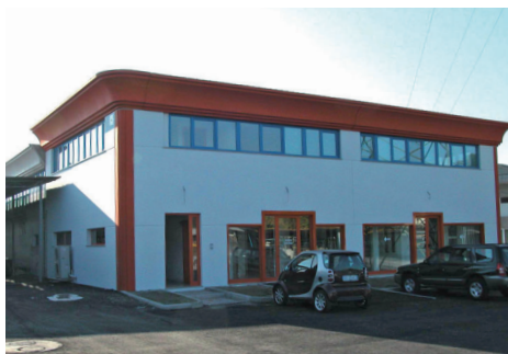
Vista esterna dello show-room.