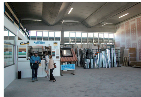
Il magazzino dall'interno.