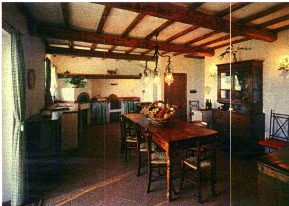
Edilizia rustica per il bed&breakfast made in Italy.

Per la ristrutturazione dell'immobile abitativo utilizzato anche nell'attività di bed & breakfast, non importa se occasionale o abituale, il bonus Irpef del 36% spetta sulla metà delle spese sostenute, in armonia con il principio affermato, in relazione ai fabbricati promiscui, con la circolare n. 57/98: lo ha specificato l'Agenzia delle Entrate (con la risoluzione n. 18 del 24 gennaio 2008) rispondendo al quesito di un contribuente - comproprietario di un immobile a uso abitativo a servizio di bed&breakfast, aveva chiesto di sapere se, relativamente alla quota delle spese di ristrutturazione di detto immobile rimasta a proprio carico, potesse usufruire della detrazione d'imposta di cui all'art. 1 della legge n. 449/97. L'Agenzia osser-